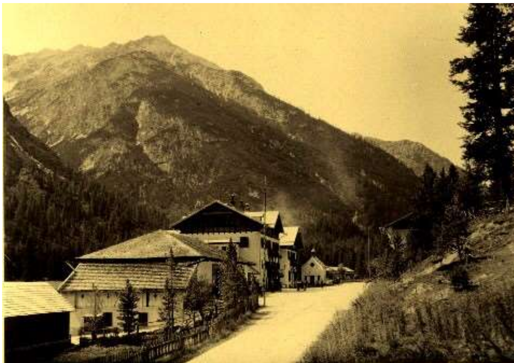
Schluderbach (Eötvös L. 1910 körül)