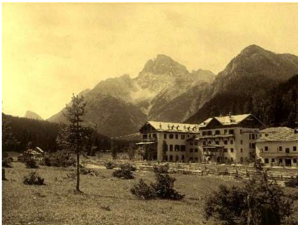
Schluderbach (Eötvös Loránd felvétele 1910 körül)

Az előadásom sok-sok kép segítségével mutatja be Eötvös hegymászó expedícióinak helyszínét, környezetét, és azt is, hogy hogyan sikerült Eötvös Loránd 11, kb. 100 éves felvételének pontos helyét beazonosítani, megismételni.