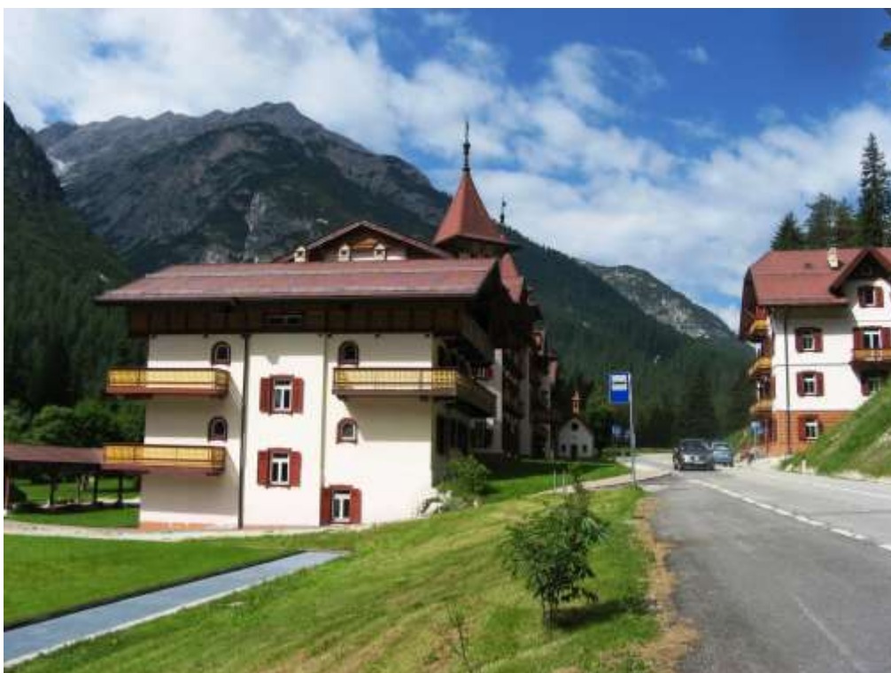
Schluderbach (Perneckzy L. 2008.)