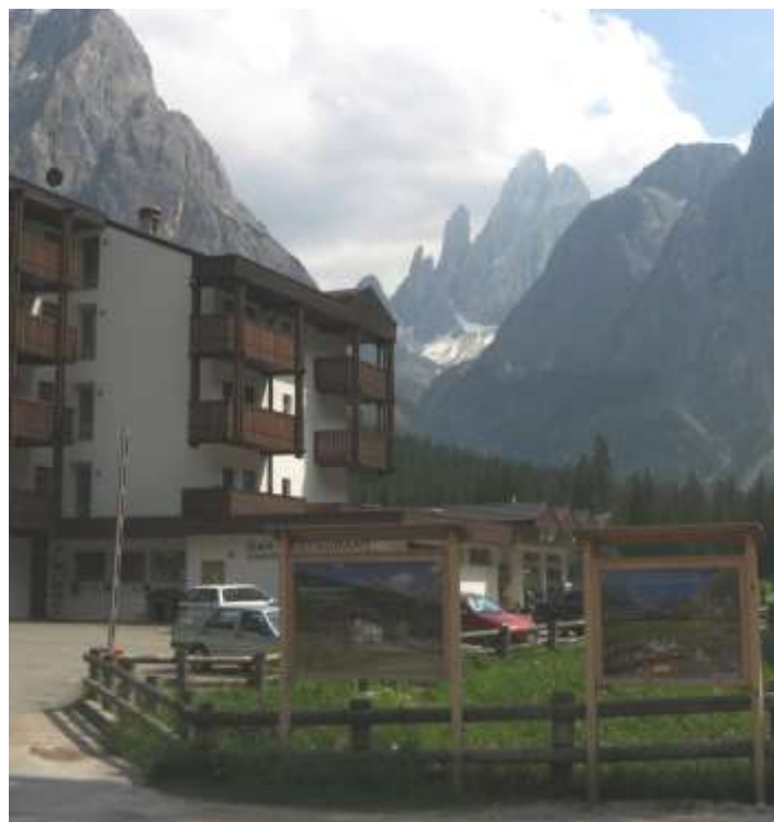
Dolomitenhof, hátul a Zwölferkofel (Perneckzy L. 2008.)