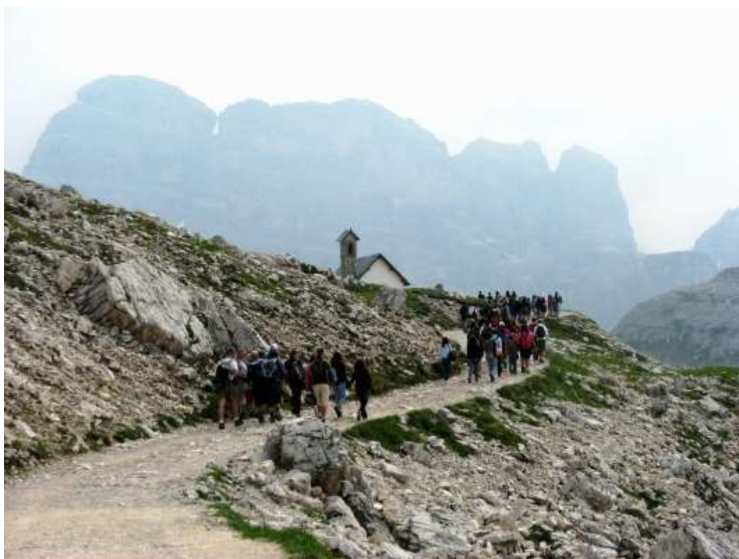
Nem „Zwei Wölferkofel”, hanem a Zwölferkofel oldalról, csúcsforgalomban (Pernecky L. 2008.)