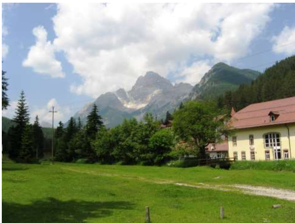
Schluderbach 2008-ban (Perneczky L.) (a fák már megnöttek, a fő épületet takarják).