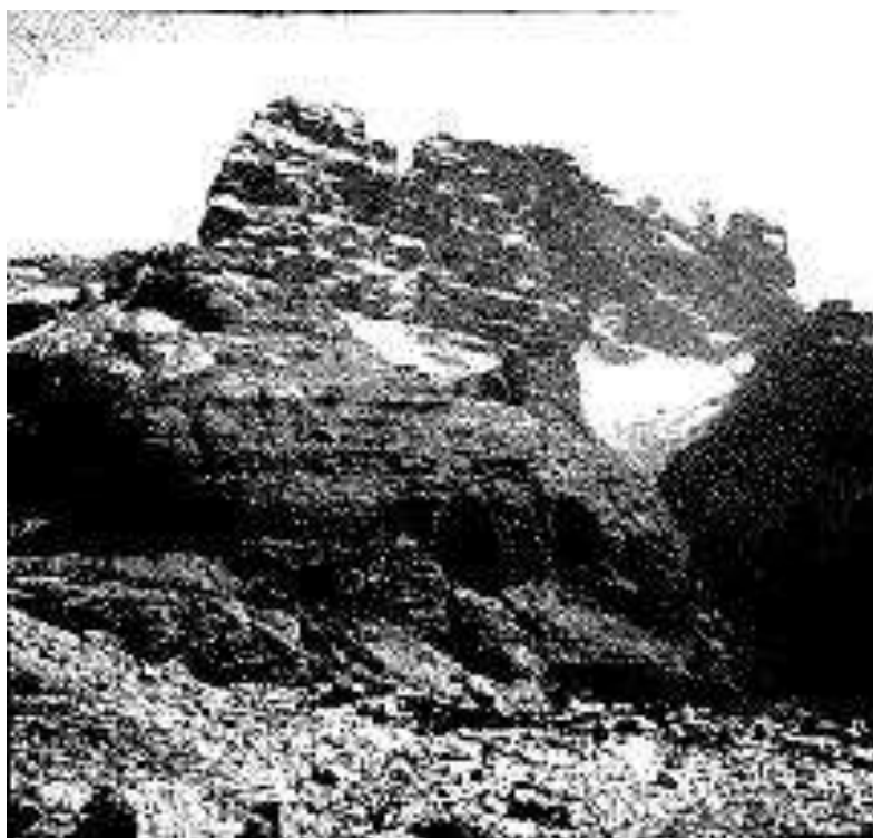
Zwei Wölferkofel (Eötvös L. sztereo felvételének egyik fele 1910 körül)